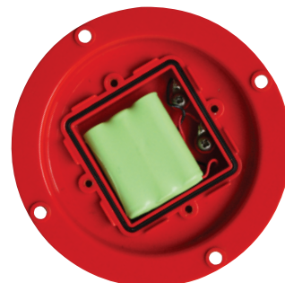
Batería reemplazable por el usuario

Otros patrones de destellos disponibles bajo pedido